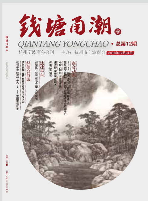
《钱江涌潮》杭州市宁波商会会刊 总第十二期